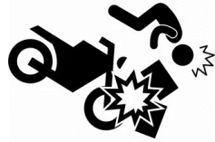
Столкновение мототранспорта со статическим предметом: