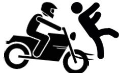
Столкновение мототранспорта с пешеходом: