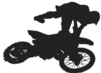
Падение с движущегося мототранспорта: